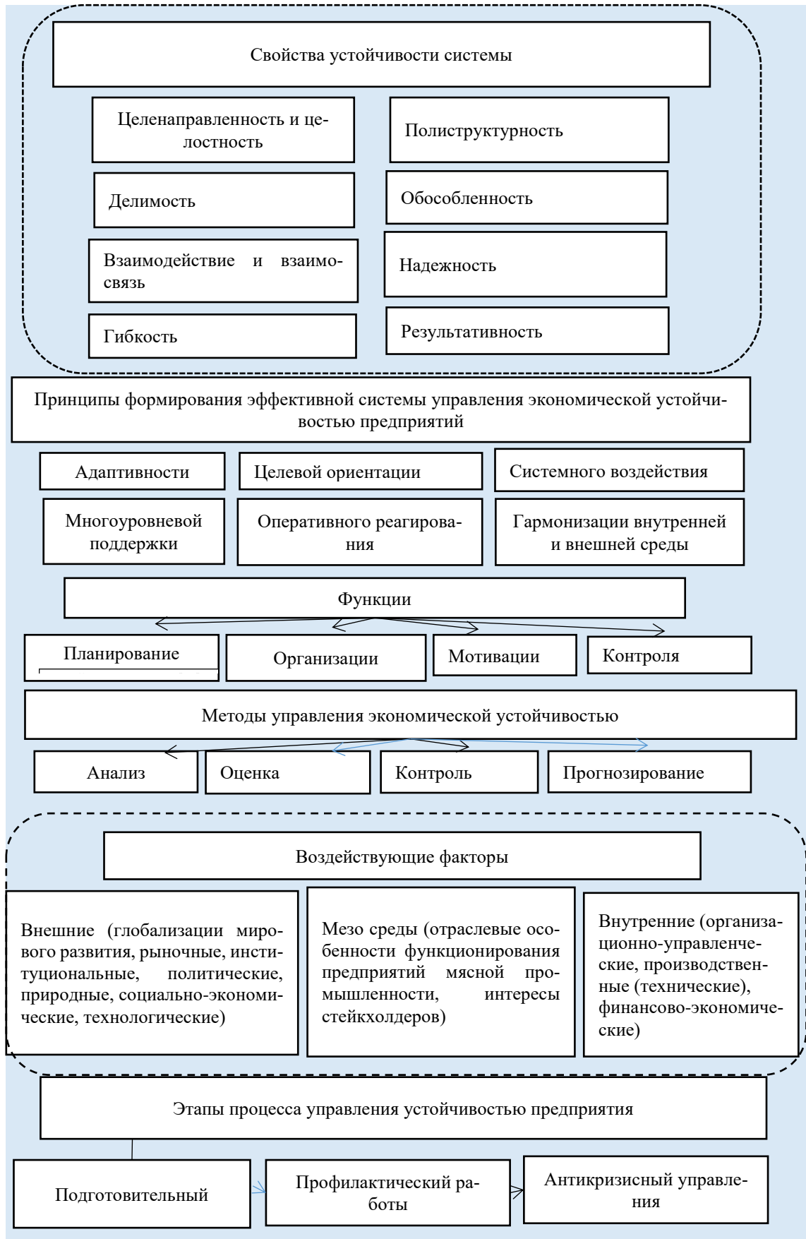
Рисунок 1. – Инструменты механизма управления экономической устойчивостью предприятия